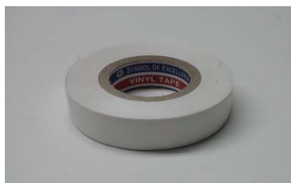
圖 3 白色電工膠帶