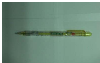
圖 1 木板片間縫隙特寫