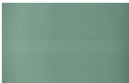
圖 4 白色底膠接縫特寫