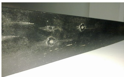
圖 5 (a)卸貨區模擬配電盤突出物