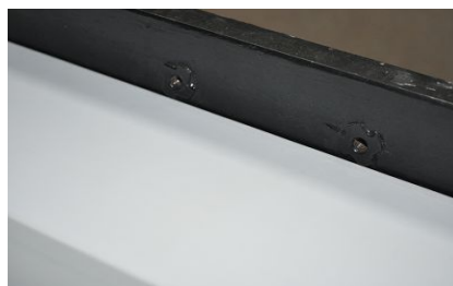
圖 5 (b)存貨區模擬配電盤突出物