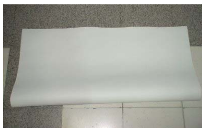
圖 2 白色底膠