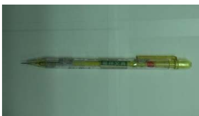
(a) 木板片間縫隙特寫