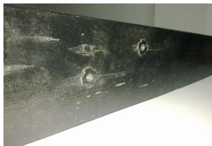
(e) 模擬配電盤突出物