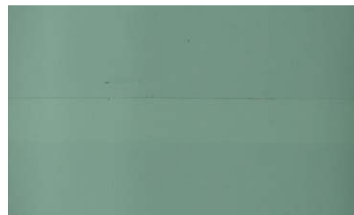
(d) 白色底膠接縫特寫